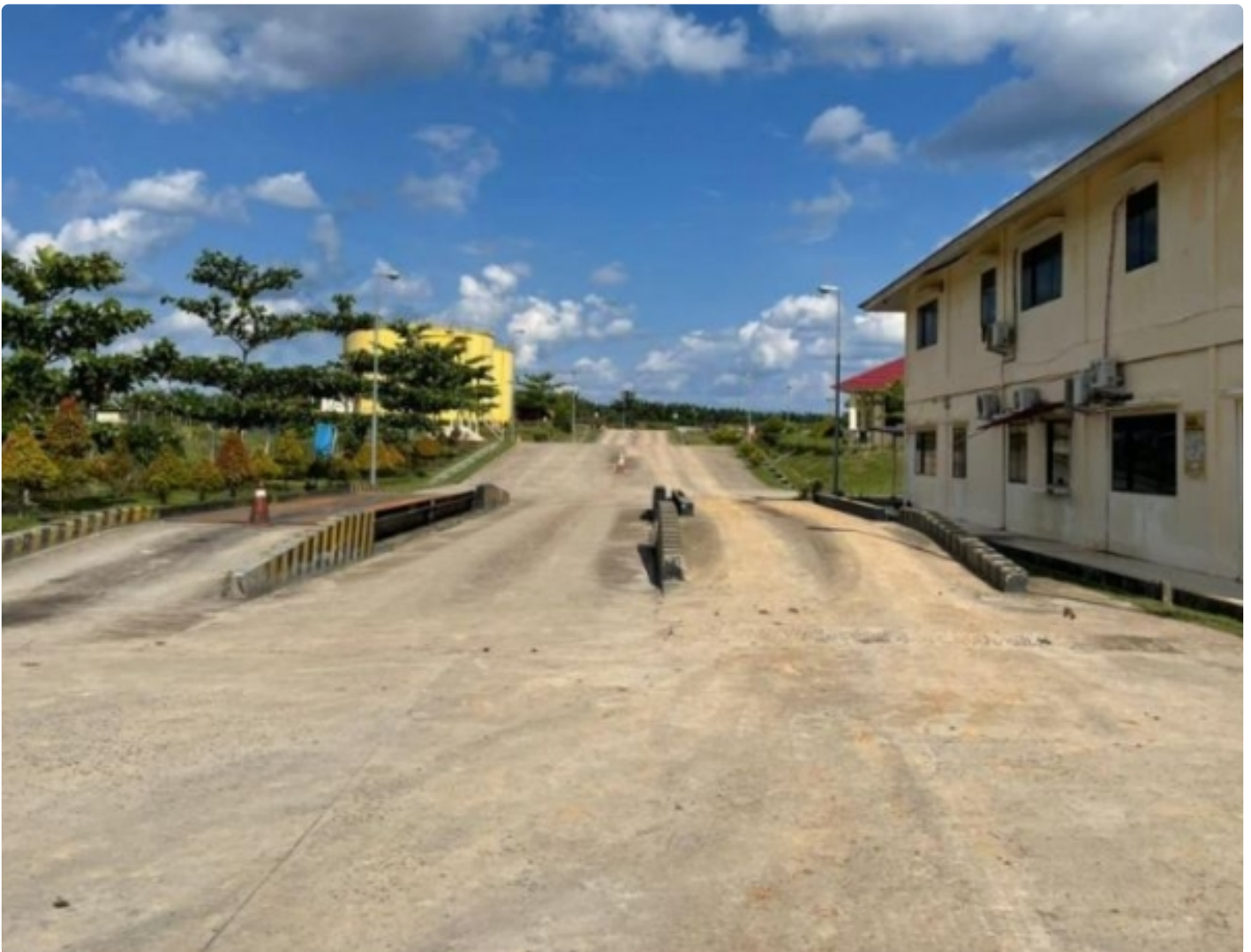
Pabrik PT Berkala Maju Bersama (PT BMB) Kecamatan Manuhing Kabupaten Gunung Mas

PALANGKA RAYA - Kisruhnya keadaan perusahaan yang bergerak di bidang perkebunan kelapa sawit di Kecamatan Manuhing Kabupaten Gunung Mas (Gumas), Kalimantan Tengah (Kalteng) yaitu PBS PT Berkala Maju Bersama (PT BMB).